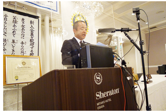
▲就任挨拶(金山幹事代読)