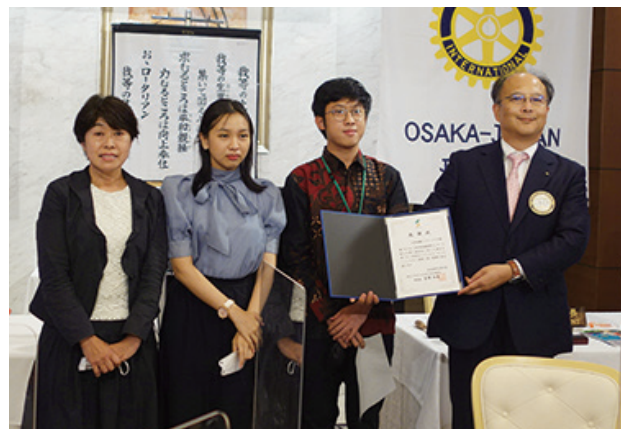
▲感謝状を頂きました