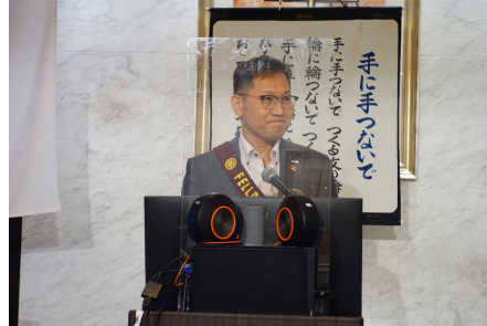
会場写真/出席報告

は老若男女が楽しめる魅力あるスポーツです。日本パデル協会や既に開設しているパデルクラブ、今後新規に開設予定のクラブ、またパデル愛好者の皆様と力を合わせてパデルの発展に努めて参りたいと希望しています。