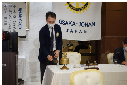
会場写真/会長 点鐘