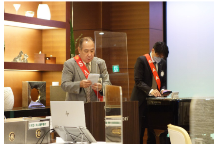
会場写真/にこにこ箱