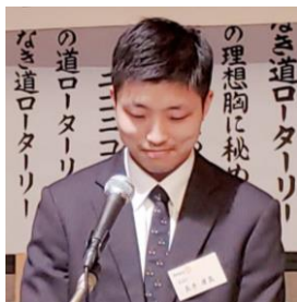
「RAC 2022-23 年度活動報告及び次年度活動予定」