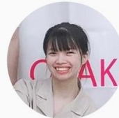
チャン ティ トウ タオ