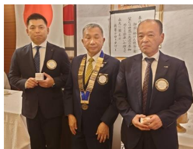
前会長、前幹事 バッジ贈呈