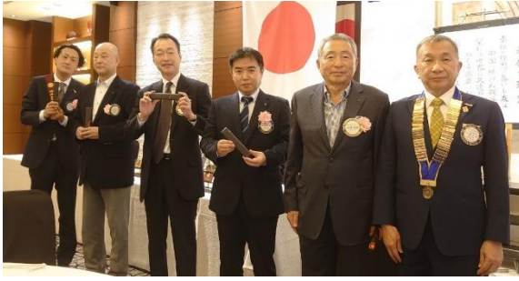
7月誕生日 内藤会員、元氏会員 三宅会員、南賀会員、田中会員