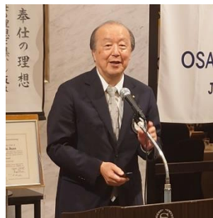
土井会員による 「COVID-19 感染症の現状」