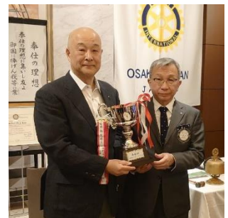
第 1 回ゴルフコンペ優勝 南賀会員