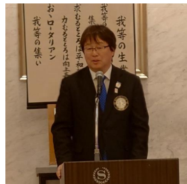
ご来訪の片山ガバナー補佐よりご挨拶