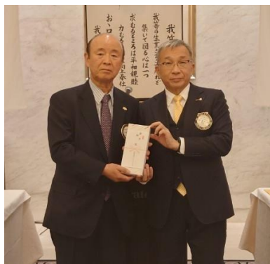
傘寿お祝い 中本会員